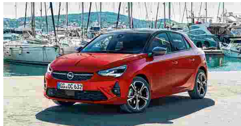
Unter der Alu-Haube des neuen Corsa arbeiten hocheffiziente Motoren.

Sehr zurückhaltend beim Verbrauch sind auch die Benziner: Der Einstiegsmotor mit 75 PS und 5-Gang-Schaltgetriebe (ab 14.639 Euro) begnügt sich mit 4,1 Liter auf 100 Kilometer. Das entspricht 93 Gramm CO 2 je Kilometer.