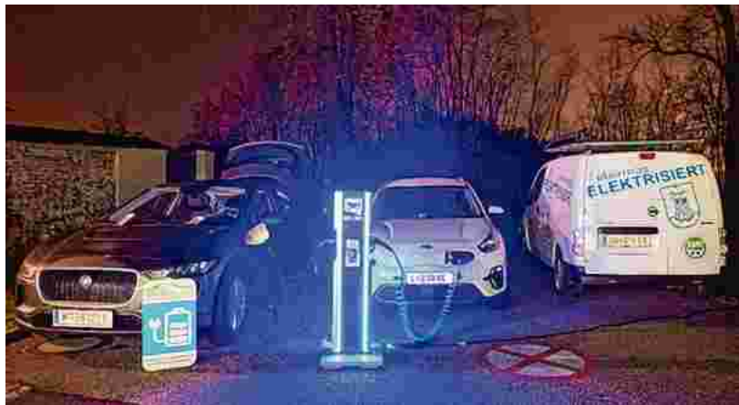
Die Veranstaltung im Schloss Steyregg war ein „Green Event“.