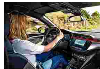
Modernes Cockpit, volle Vernetzung

Erstmals bietet Opel eine batterie-elektrische Corsa-Variante an