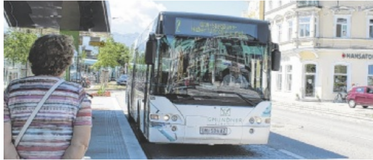
Citybus-Routen werden ab 1. September auf die Traunseetram abgestimmt.

GMUNDEN. Anfang September nimmt die Traunseetram ihren Betrieb auf. Gemeinsam mit einem angepassten Busnetz soll sie den Umstieg auf den öffentlichen Verkehr erleichtern.